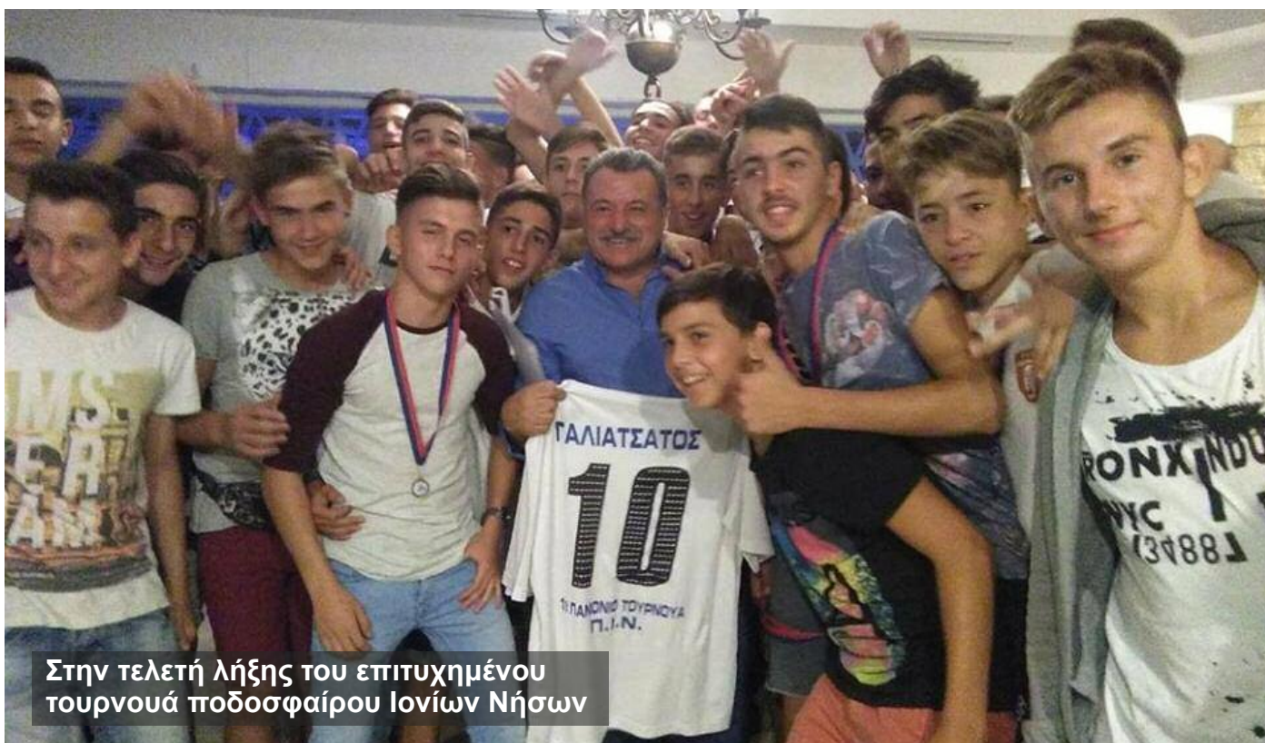
Στην τελετή λήξης του επιτυχημένου τουρνουά ποδοσφαίρου Ιονίων Νήσων