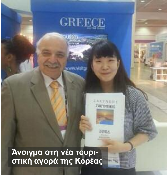
Άνοιγμα στη νέα τουριστική αγορά της Κορέας

Τα Ιόνια Νησιά έκλεισαν την τουριστική περίοδο 2016 ευρισκόμενα στην πρώτη θέση, με άνοδο στο ποσοστό αφίξεων (σε σχέση με το 2015) κατά 13,20%.