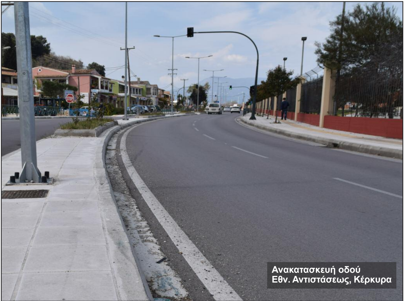
Ανακατασκευή οδού Εθν. Αντιστάσεως, Κέρκυρα