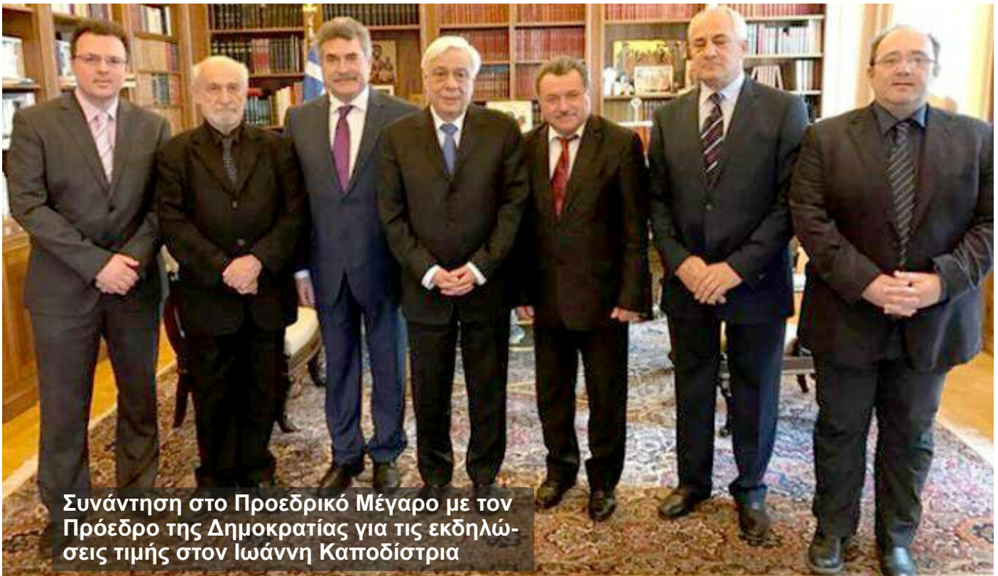
Συνάντηση στο Προεδρικό Μέγαρο με τον Πρόεδρο της Δημοκρατίας για τις εκδηλώσεις τιμής στον Ιωάννη Καποδίστρια