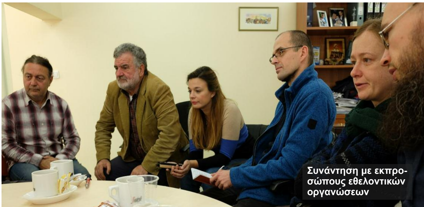
Συνάντηση με εκπροσώπους εθελοντικών οργανώσεων

Ανθρωποκεντρική προσέγγιση με στόχο την «Αντιμετώπιση της φτώχειας και του κοινωνικού αποκλεισμού»