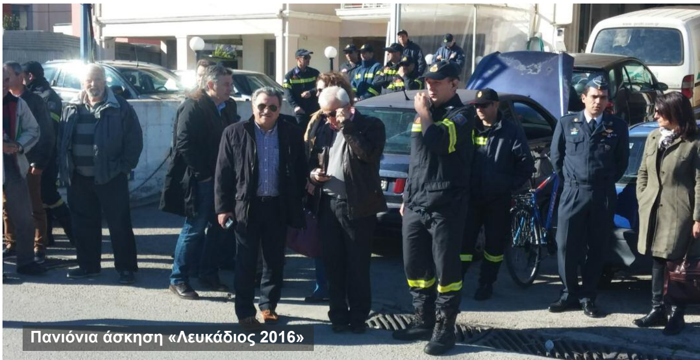
Πανιόνια άσκηση «Λευκάδιος 2016»