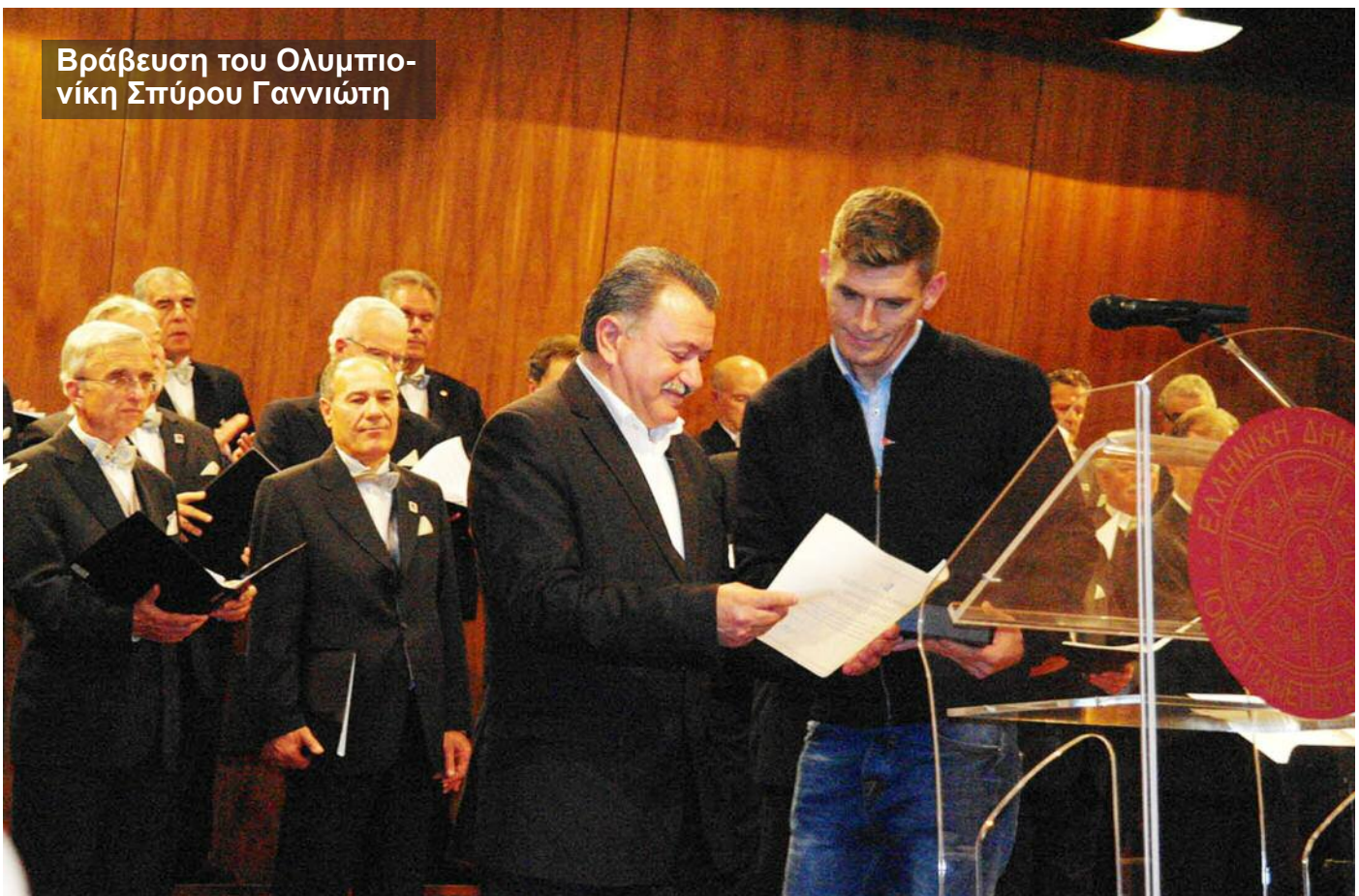
Βράβευση του Ολυμπιονίκη Σπύρου Γιαννιώτη

► Τιμώντας τους ανθρώπους του πολιτισμού, τους δώσαμε φωνή και δυνατότητα παρέμβασης στη διαμόρφωση του πολιτισμού μας. Διοργανώσαμε την 1 η Πανιόνια Πολιτιστική Συνάντηση στη Λευκάδα, θέτοντας τις βάσεις για μια αμφίδρομη επικοινωνία και μια δυναμική σχέση πολιτιστικών σωματείων και ΠΙΝ.