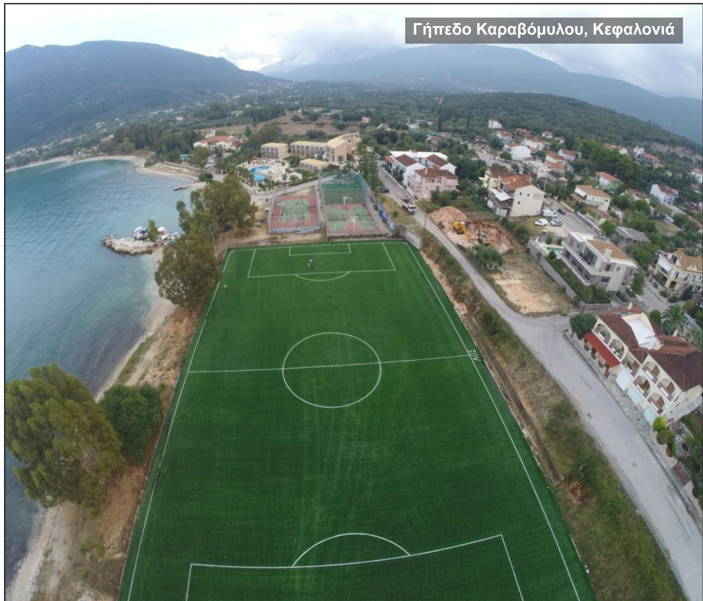
Γήπεδο Καραβόμυλου, Κεφαλονιά