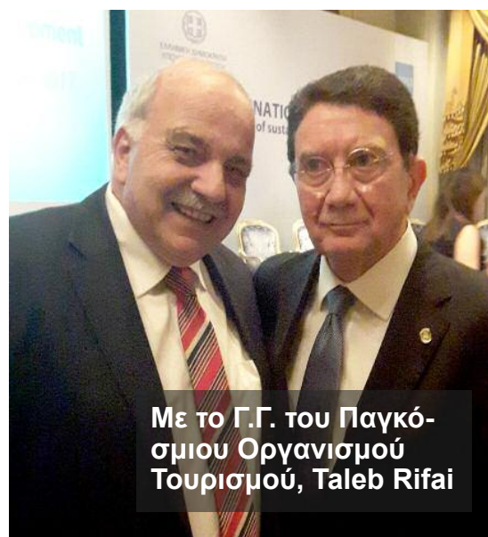
Με το Γ.Γ. του Παγκόσμιου Οργανισμού Τουρισμού, Taleb Rifai