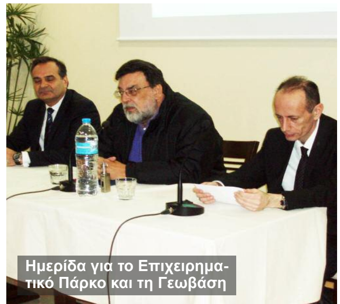
Ημερίδα για το Επιχειρηματικό Πάρκο και τη Γεωβάση

2/ Εγκρίθηκε από το ΠΣ και εκδόθηκε η σχετική ΚΥΑ (63085/5401/Β/α.φ 4317/30-12-2016) για τον Περιφερειακό Σχεδιασμό Διαχείρισης Αποβλήτων (ΠΕΣΔΑ) στα Ιόνια Νησιά. Ανοίξε έτσι ο δρόμος για την σχεδιασμένη και προγραμματισμένη χρονικά και χρηματοδοτικά εφαρμογή της Ολοκληρωμένης Διαχείρισης.