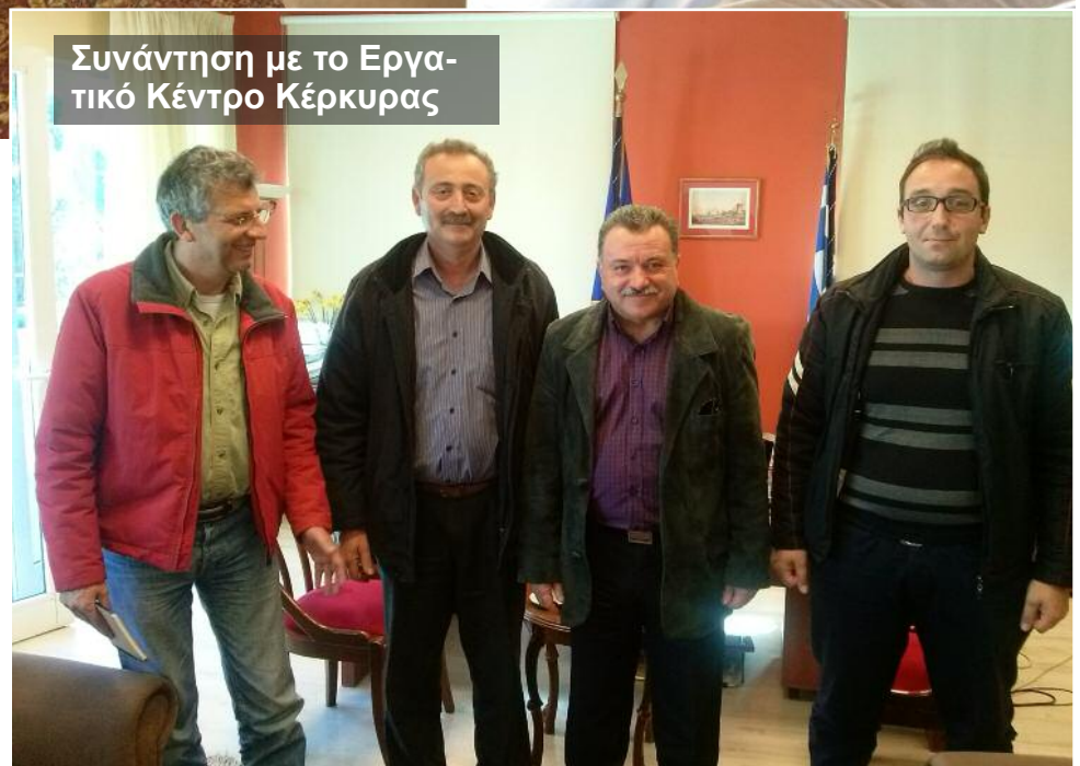
Συνάντηση με το Εργατικό Κέντρο Κέρκυρας

► Ενάντια στην εκποίηση του Ιστορικού Ψυχιατρείου Κέρκυρας , όπου σήμερα στεγάζονται δομές παροχής υπηρεσιών ψυχικής υγείας καθώς και δομές δημόσιας παιδείας (Ιόνιο Πανεπιστήμιο) αποτελώντας μια πρωτοποριακή και πολύ επιτυχημένη «συγκατοίκηση», που θα πρέ-