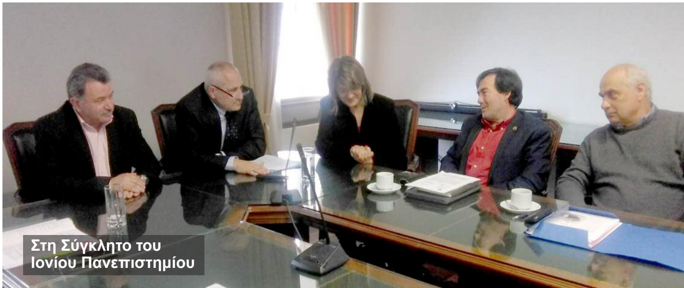
Στη Σύγκλητο του Ιονίου Πανεπιστημίου