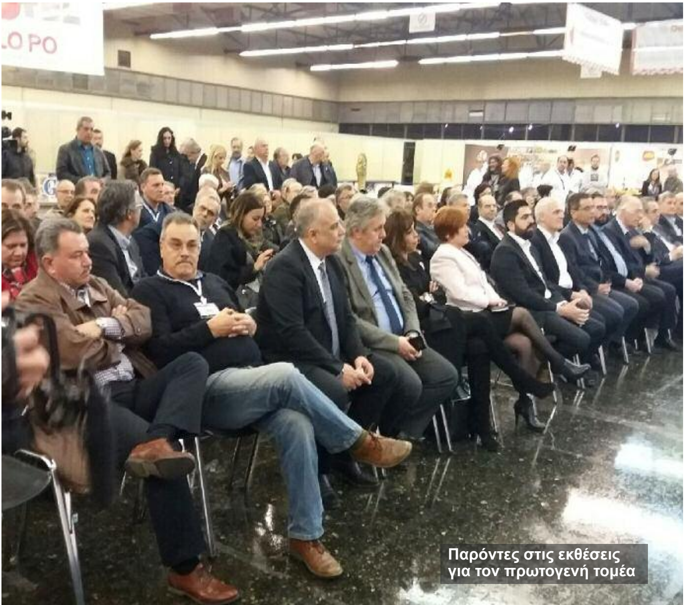
Παρόντες στις εκθέσεις για τον πρωτογενή τομέα

ο οποίος άλλωστε αποτελεί και το μεγάλο ανταγωνιστικό μας πλεονέκτημα.