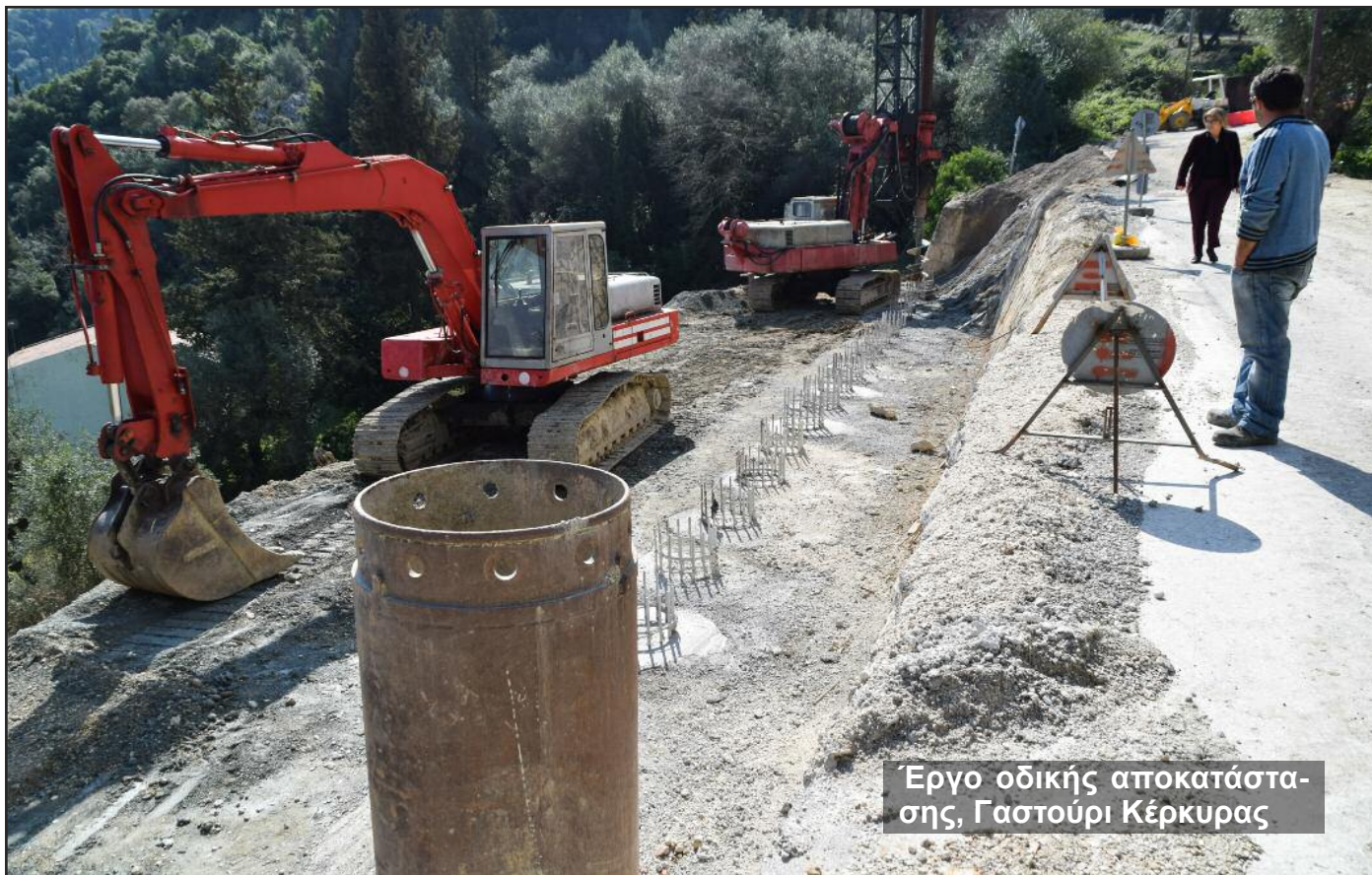
Έργο οδικής αποκατάστασης, Γαστούρι Κέρκυρας