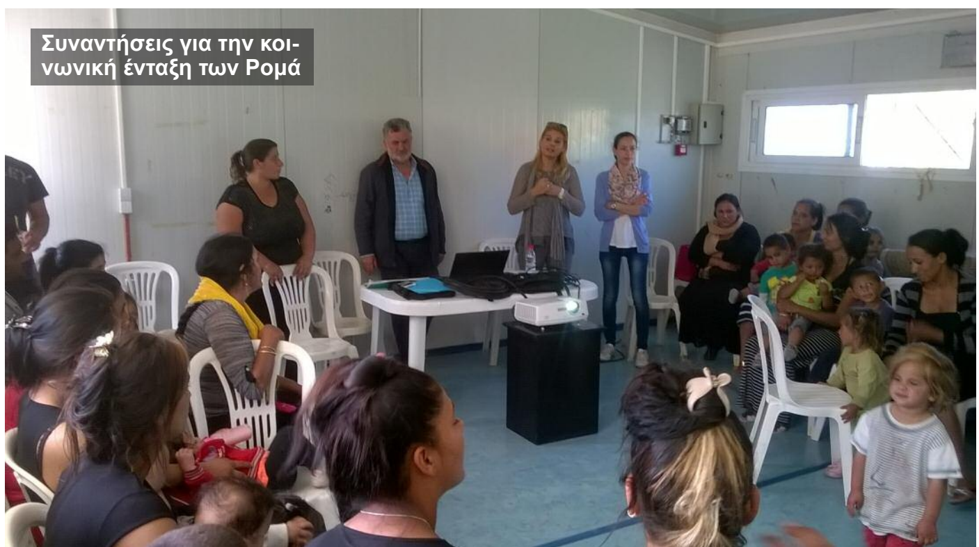
Συναντήσεις για την κοινωνική ένταξη των Ρομά

«ΟΡΙΖΟΝΤΙΕΣ ΥΠΟΣΤΗΡΙΚΤΙΚΕΣ ΠΑΡΕΜΒΑΣΕΙΣ».