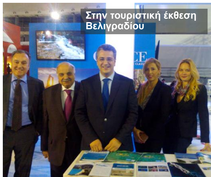
Στην τουριστική έκθεση Βελιγραδίου

Επιχειρησιακό Σχέδιο Τουριστικής Προβολής