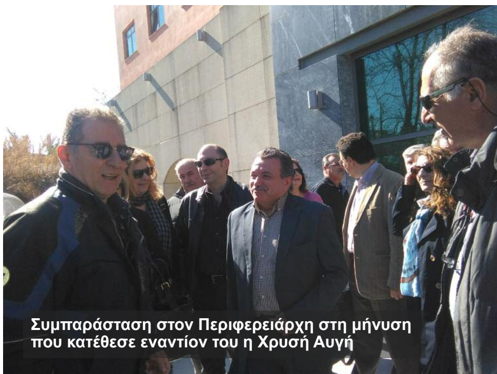
Συμπαράσταση στον Περιφερειάρχη στη μήνυση που κατέθεσε εναντίον του η Χρυσή Αυγή

Η άρνησή μας για την παραχάραξη της ιστορίας της χώρας μας και η επιμονή μας στην ανάδειξη της συμβολής του ελληνικού λαού στους αγώνες, μας οδήγησαν αντιμέτωπους με τη δικαιοσύνη, μετά από αλληπάλληλες μηνύσεις της Χρυσής Αυγής στον Περιφερειάρχη Ιονίων Νήσων και τον