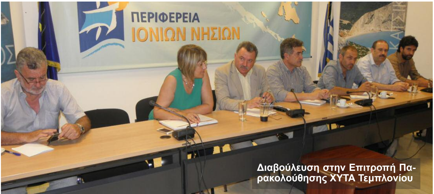
Διαβούλευση στην Επιτροπή Παρακολούθησης ΧΥΤΑ Τεμπλονίου

μέσης και χαμηλής όχλησης στην Κέρκυρα. Στην εταιρεία συμμετέχουν το Περιφερειακό Ταμείο Ανάπτυξης, ο Δήμος