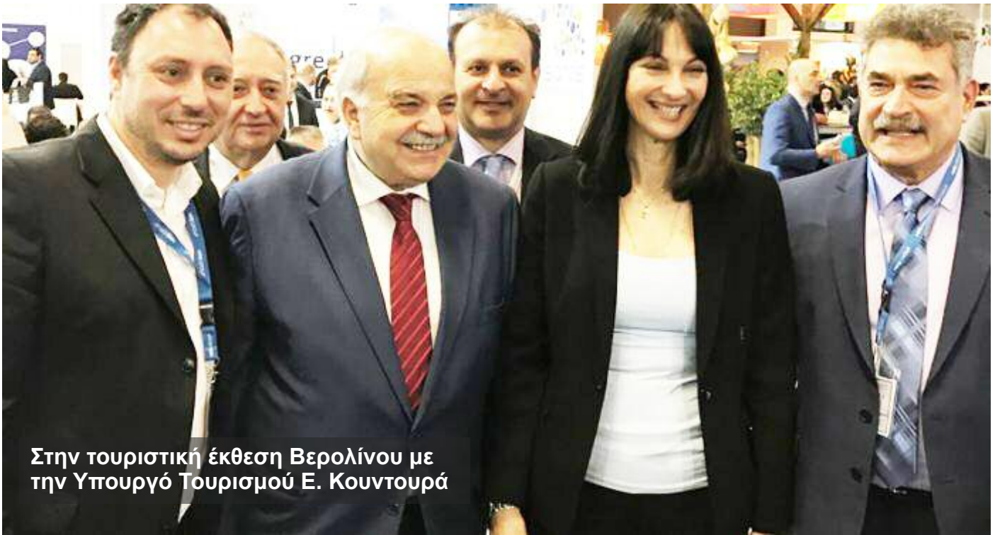
Στην τουριστική έκθεση Βερολίνου με την Υπουργό Τουρισμού Ε. Κουντουρά

Συμβούλιο Στρατηγικό Σχέδιο για τον Τουρισμό, θέσαμε τους εξής συγκεκριμένους στόχους :