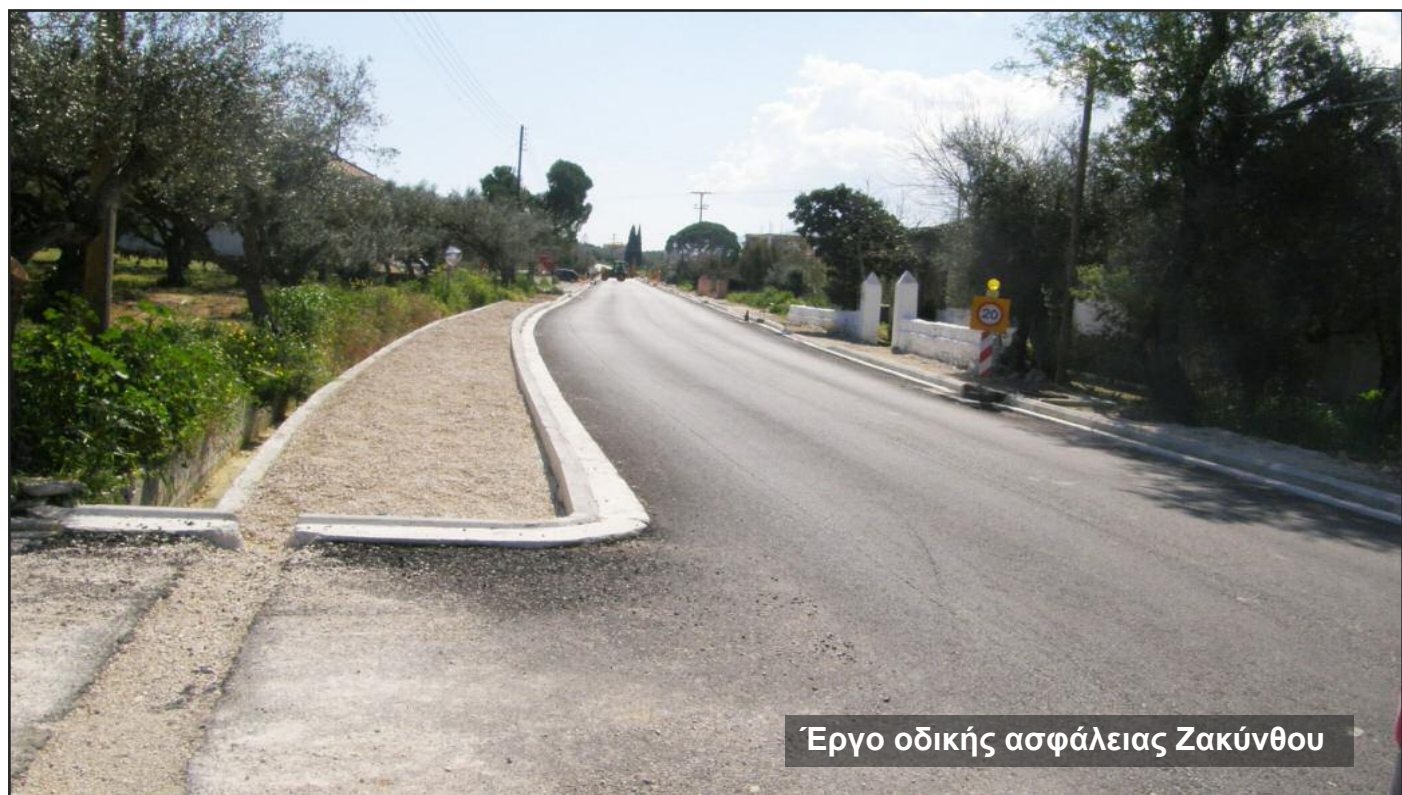
Έργο οδικής ασφάλειας Ζακύνθου