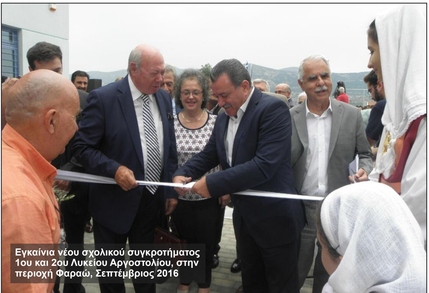
Εγκαίνια νέου σχολικού συγκροτήματος 1ου και 2ου Λυκείου Αργοστολίου, στην περιοχή Φαραώ, Σεπτέμβριος 2016