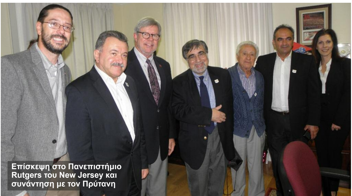
Επίσκεψη στο Πανεπιστήμιο Rutgers του New Jersey και συνάντηση με τον Πρύτανη

► Επίσης με πρωτοβουλία του Περιφερειάρχη Ιονίων Νήσων πραγματοποιήθηκε συνάντηση στην οποία συμμετείχαν επίσης οι Περιφερειάρχες Αργυρόκαστρου, Μπεράτι, Κορυτσάς και Αυλώνα όπου συζητήθηκαν οι στρατηγικές προτεραιότητες των Περιφερειών με στόχο την από κοινού κατάθεση προτάσεων στο πλαίσιο της διμερούς συνεργασίας Ελλάδας – Αλβανίας.