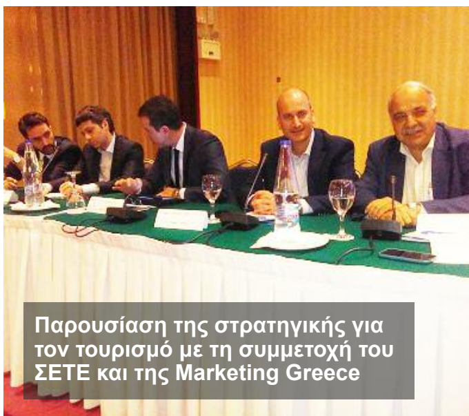
Παρουσίαση της στρατηγικής για τον τουρισμό με τη συμμετοχή του ΣΕΤΕ και της Marketing Greece

Επαγγελματισμός, διαφάνεια & συμμετοχή όλων