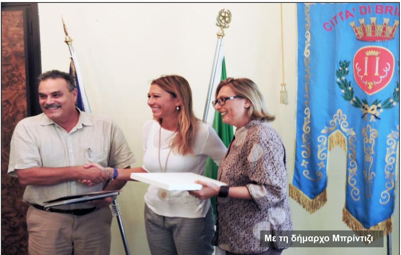
Με τη δήμαρχο Μπρίντιζι