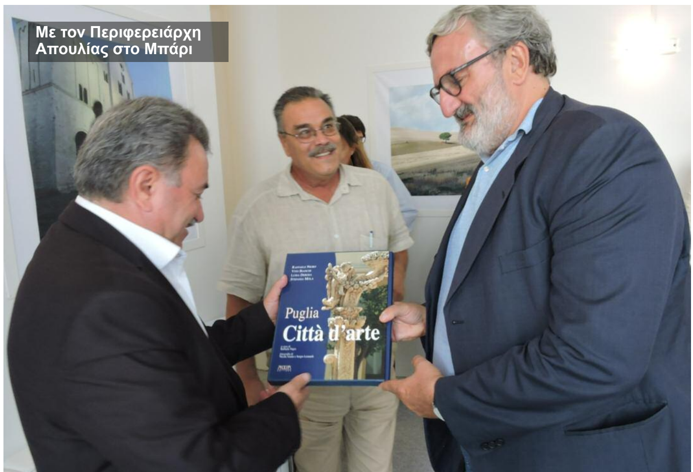
Με τον Περιφερειάρχη Απουλίας στο Μπάρι

Η ανάδειξη των πολιτιστικών αλλά και φυσικών πόρων της Περιφέρειας αποτέλεσε επίσης στρατηγική προτεραιότητα με τουλάχιστον 18 προτάσεις, συμπεριλαμβανομένων και προτάσεων που συνδέουν όχι μόνο τον τουρισμό αλλά και τον πολιτισμό με την απασχόληση και την κοινωνική οικονομία (3 προτάσεις). Τέλος, μία στοχευμένη πρόταση επικεντρώθηκε στις