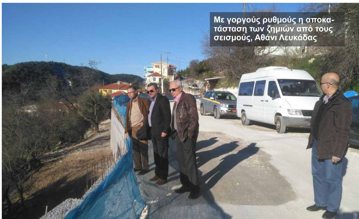
Με γοργούς ρυθμούς η αποκατάσταση των ζημιών από τους σεισμούς, Αθάνι Λευκάδας

Η άσκηση είχε το κωδικό όνομα «Λευκάδιος 2016» και γεωγραφική εφαρμογή στην Λευκάδα.