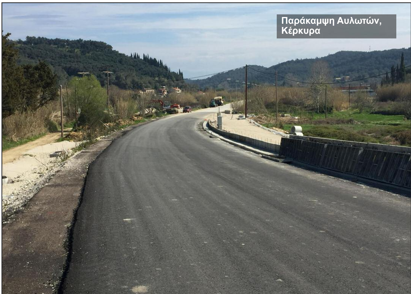
Παράκαμψη Αυλωτών, Κέρκυρα