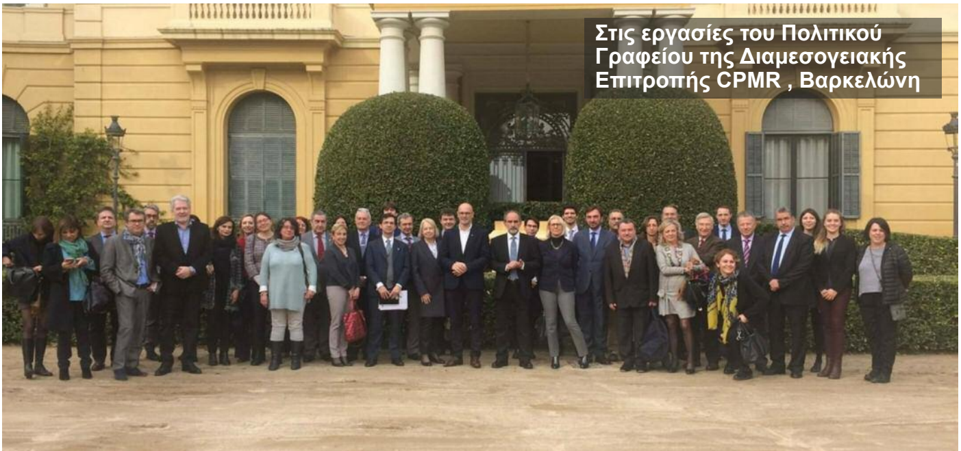
Στις εργασίες του Πολιτικού Γραφείου της Διαμεσογειακής Επιτροπής CPMR, Βαρκελώνη

των αθλητών μας στην Κέρκυρα, αποδίδοντας τιμή στον Ολυμπιονίκη μας Σπύρο Γιαννιώτη και στη Ζάκυνθο, με τη συμμετοχή του θρύλου του μπάσκετ Παναγιώτη Γιαννάκη και διακεκριμένων αθλητών. Και οι δύο τελετές έτυχαν καθολικής αποδοχής από τους πολίτες που γέμισαν ασφυκτικά τις αίθουσες της διοργάνωσης. Για εμάς ήταν οφειλόμενη τιμή στους αθλητές μας, μια τιμή που πρώτη φορά – δυστυχώς – πραγματοποιήθηκε στα νησιά μας. Έπονται ανάλογες