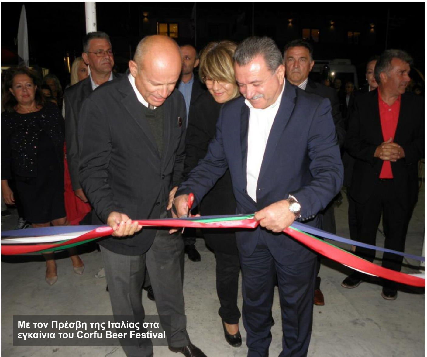
Με τον Πρέσβη της Ιταλίας στα εγκαίνια του Corfu Beer Festival

Ενώ στο πλαίσιο της επίσκεψής μας στο Μόντρεαλ συναντηθήκαμε με την Επιτροπή Συμπαραστάσης Παιδικών Ιδρυμάτων της Ελλάδας «MagicMission» που έχει προσφέρει 14.000 ευρώ για τα σχολεία της Κεφαλονιάς που επλήγησαν από τους σεισμούς , με τον Πρόξενο της Ελλάδας στο Μόντρεαλ Νικόλαο Σιγάλα, τον Πρόεδρο της Ελληνικής Κοινότητας Μείζονος Μοντρεαλ Νικόλα Παγώνη, τον Πρέσβη της Ελλάδας στον Καναδά Γιώργο Μαρκαντωνάτο και την αντιδήμαρχο Μόντρεαλ Μαίρη Ντέρος. Το σύνολο των επαφών καλύφθηκε από όλα τα ΜΜΕ της ομογένειας, που επί σειρά ημερών παρουσίαζαν τα Ιόνια Νησιά και τις ομορφιές τους.