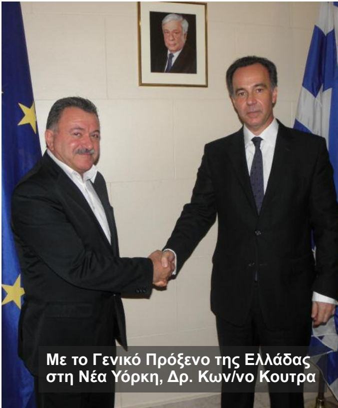
Με το Γενικό Πρόξενο της Ελλάδας στη Νέα Υόρκη, Δρ. Κων/νο Κουτρα

ξενο της Ελλάδας στη Νέα Υόρκη Δρ. Κωνσταντίνο Κούτρα για την πιθανότητα εξαγωγής τοπικών προϊόντων από τα Ιόνια Νησιά στις Η.Π.Α., με τον Πρύτανη του Πανεπιστημίου Rutgers Richard L. Edwards για τις προοπτικές συνεργασίας της Περιφέρειας Ιονίων Νήσων και του Αμερικανικού Πανεπιστημίου.