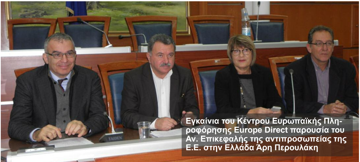
Εγκαίνια του Κέντρου Ευρωπαϊκής Πληροφόρησης Europe Direct παρουσία του Αν. Επικεφαλής της αντιπροσωπείας της Ε.Ε. στην Ελλάδα Άρη Περούλακη

τήθηκε συνεργασία στον τουρισμό, τον πολιτισμό και τα τοπικά προϊόντα, ενώ πιθανότητες συνεργασίας εξετάστηκαν και στη συνάντηση που είχε με την Πρέσβειρα του Ισραήλ και τον Εμπορικό Ακόλουθο της Πρεσβείας Πολωνίας .