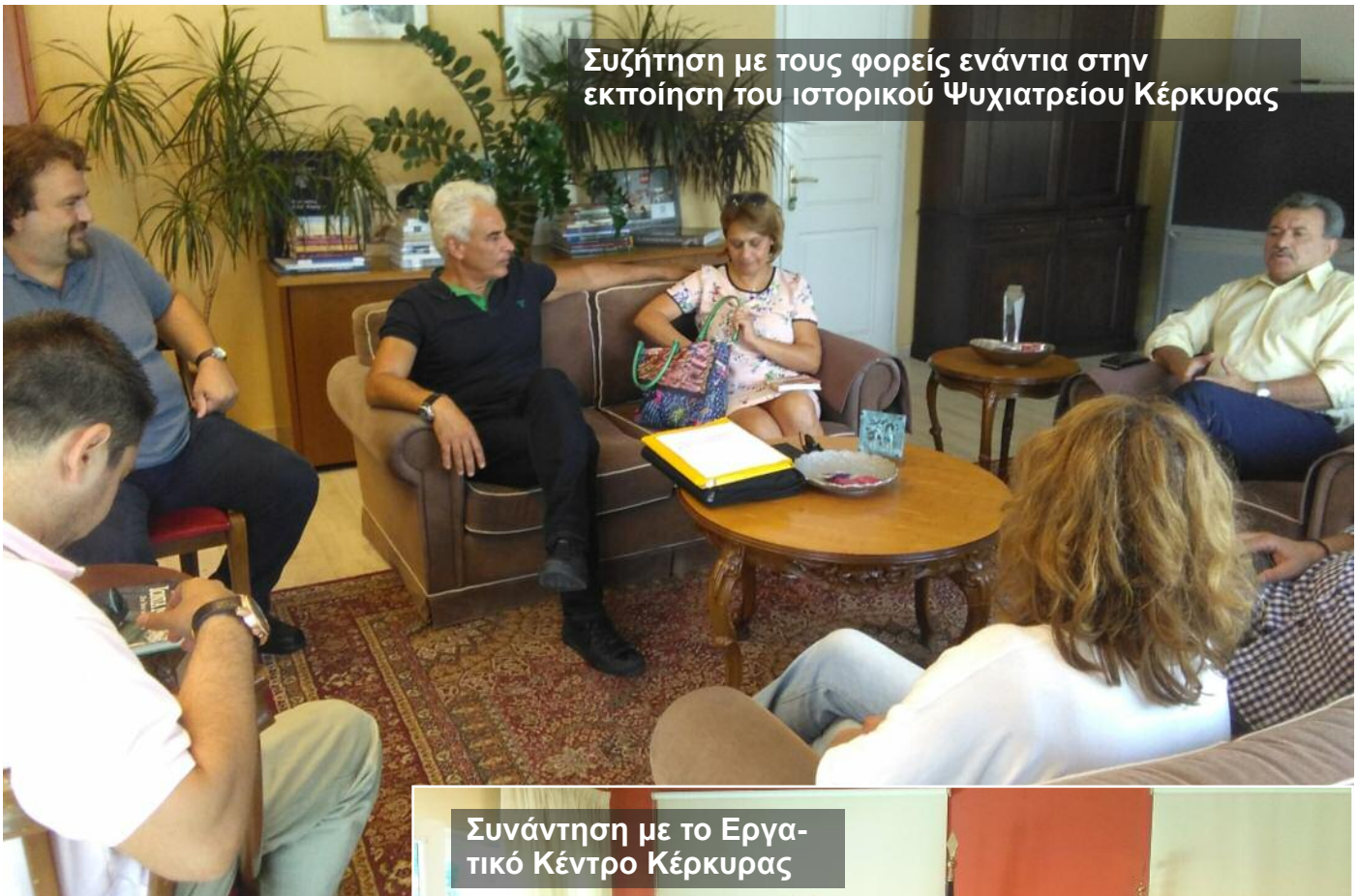
Συζήτηση με τους φορείς ενάντια στην εκποίηση του ιστορικού Ψυχιατρείου Κέρκυρας

Πρωτοστατούμε και διατρανώνουμε το δίκαιο του αγώνα μας με συμμετοχή στην πανελλήνια «Κοινή Πρωτοβουλία ενάντια στην ιδιωτικοποίηση των 14 αεροδρομίων», με την κατάθεση δικαστικής προσφυγής στο ΣΤΕ, την ανάδειξη της ετεροβαρούς για τα συμφέροντα των πολιτών συμφωνίας με όλα τα πρόσφορα μέσα, την συνεπή –μετά τη λαϊκή εντολή που λάβαμε – άρνησή μας να προσφέρουμε γη και ύδωρ στην Fraport και το ΤΑΙΠΕΔ.