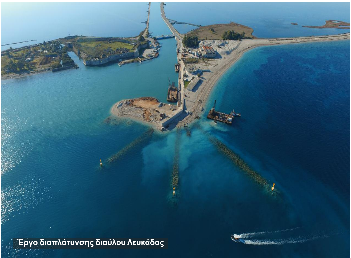
Έργο διαπλάτυνσης διαύλου Λευκάδας

Η συνεχής κατάθεση αιτημάτων από τους δικαιούχους για παράταση του χρόνου υποβολής προτάσεων, όπως αυτός έχει καθοριστεί από τις εκδοθείσες προσκλήσεις έργων και δράσεων, εκτιμούμε ότι θα έχει αρνητικό αποτέλεσμα στο κλείσιμο του προγράμματος και επιβάλλεται σκληρή δουλειά και συνέπεια από όλους για την αποφυγή του.